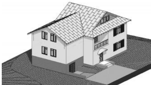
Рисунок 1. Общий вид двухэтажного коттеджа