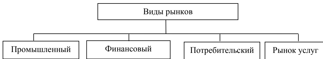
Рисунок 1 – Классификация рынков