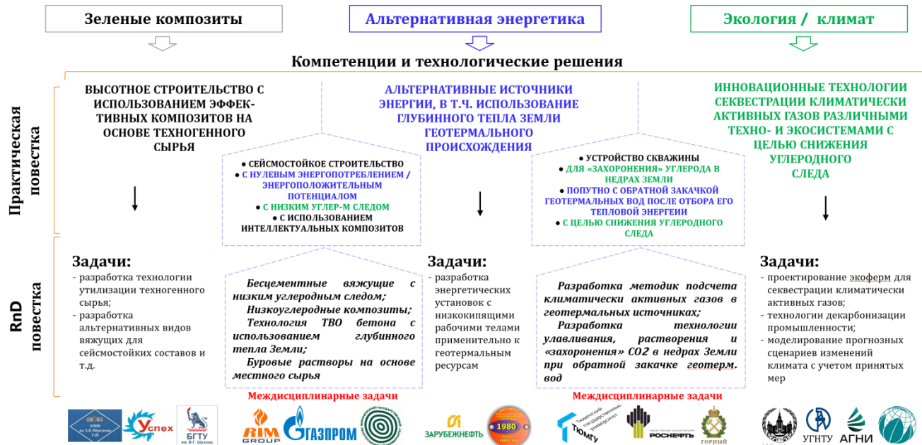
Рисунок 7.2 – Схематизация предмета RnD-политики университета с акцентом на развитие междисциплинарных исследований

Ниже представлено подробное описание научно-инновационных проектов, определенных вузом как стратегические для развития университета.